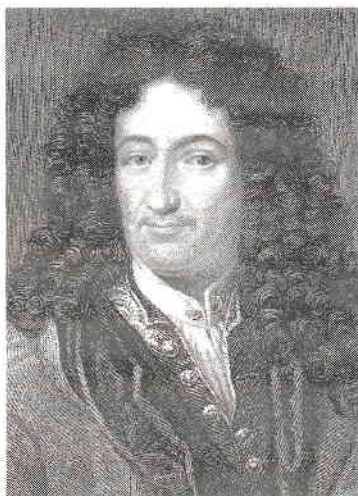
Gottfried Wilhelm Leibniz

Filosoful Leibniz rezumă în felul următor semnificația miracolului: „Dumnezeu înfăptuiește un miracol atunci când realizează ceva ce depășește puterile pe care le-a dat creaturilor” 4 . În ceea ce privește Conferința episcopilor din Franța, ea oferă următoarea definiție: „Fapt extraordinar și care trezește admirația în afara cursului obișnuit al evenimentelor. Manifestare a puterii și a intervenției lui Dumnezeu care își revelează prezența și libertatea pe care le manifestă pentru a-și împlini planurile. Biblia descrie miracolele în sensul de putere (Exodul 9, 16), minuni (Romani 1, 19-20), vindecare (Ioan 9, 1-41) și semne (Ioan 3,2). Miracolul nu este un scop în sine, el ne îndreaptă privirile spre