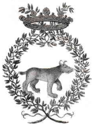
Accademia dei Lincei

Există atunci o poziție mai corectă decât alta? Din perspectiva Bisericii, răspunsul este nu. Toate pozițiile sunt corecte. Biserica se înscrie în acea abordare a credinței care duce la plenitudine crezând fără să vadă, așa cum ne îndeamnă Iisus Hristos, dar este totodată deschisă în ceea ce privește abordarea rațională a manifestărilor dumnezeiești sau naturale. Chiar au existat și există savanți în sânul ei.